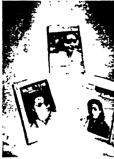
श्रुति जी के कुछ प्रचलित कैसेट्स

(5) एल0 पी0-साज-ए-दिल - सी0 बी0 एस0 - गजल